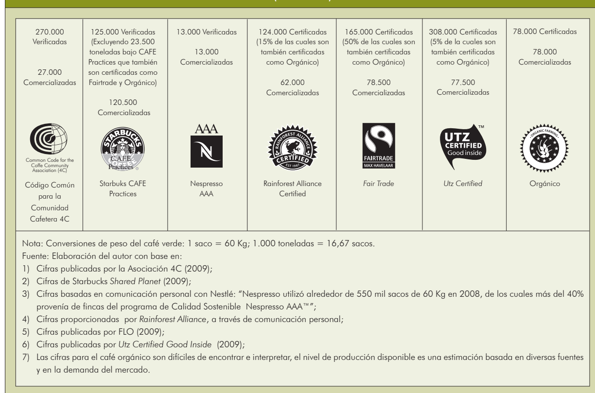
Cuadro 2. Volumen de café certificado en 2008 comparado con el café comercializado (Toneladas)

mente nuevos, Utz Certified , Rainforest Alliance y Starbucks CAFE Practices , también registraron un dramático crecimiento. El primer año operacional de la Asociación Cafetera 4C registró un aumento de 450 mil sacos de café cumpliendo con los requisitos 4C a escala mundial (4C Association, 2009). El Cuadro 2 ilustra los volúmenes de producción de café certificado en 2008, aproximadamente 18 millones de sacos versus las cantidades realmente comercializadas como certificadas alrededor de ocho millones de sacos. Debe tenerse en cuenta que