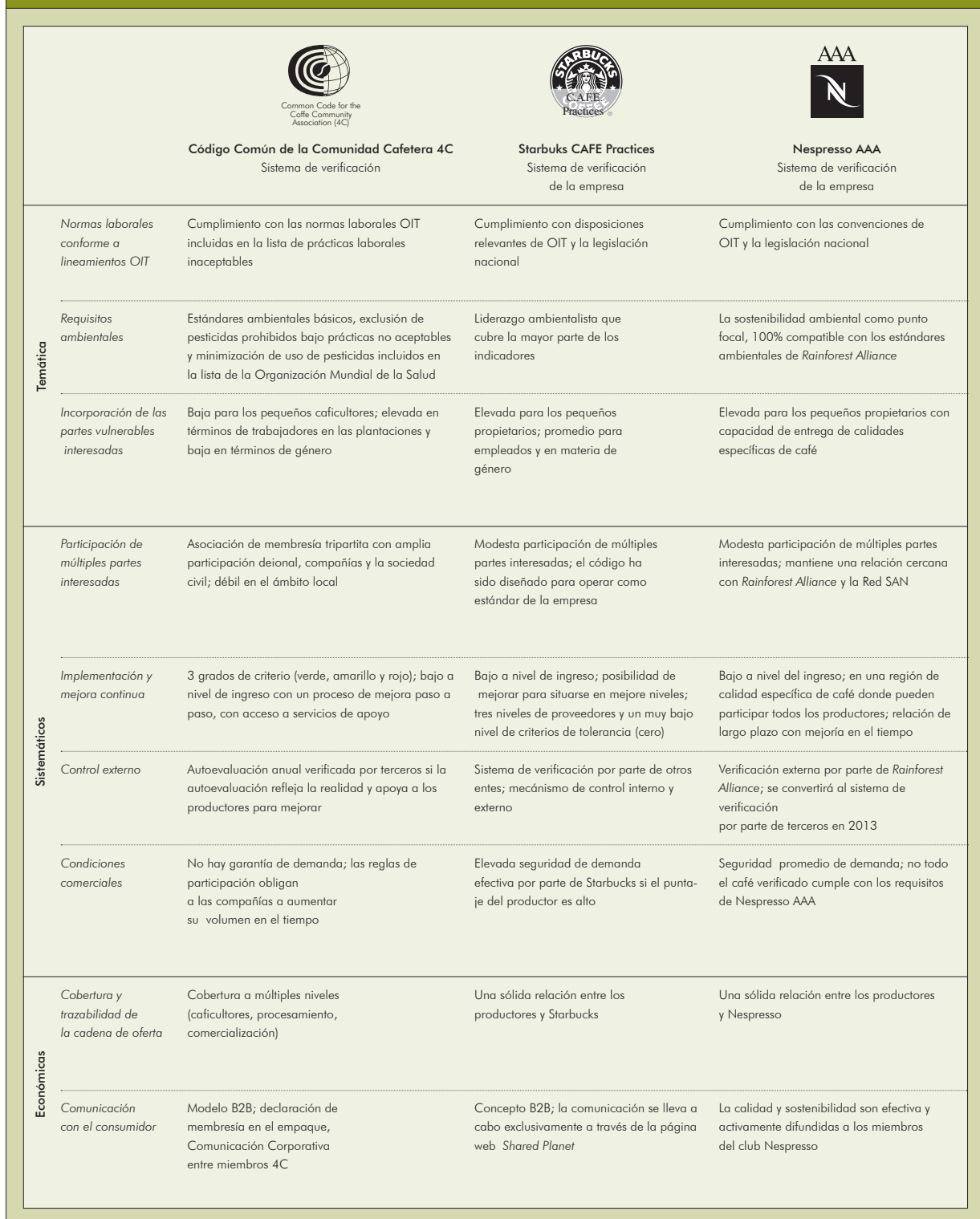
Cuadro 1. Alcance de los siete principales estándares comparados con los principios TCC