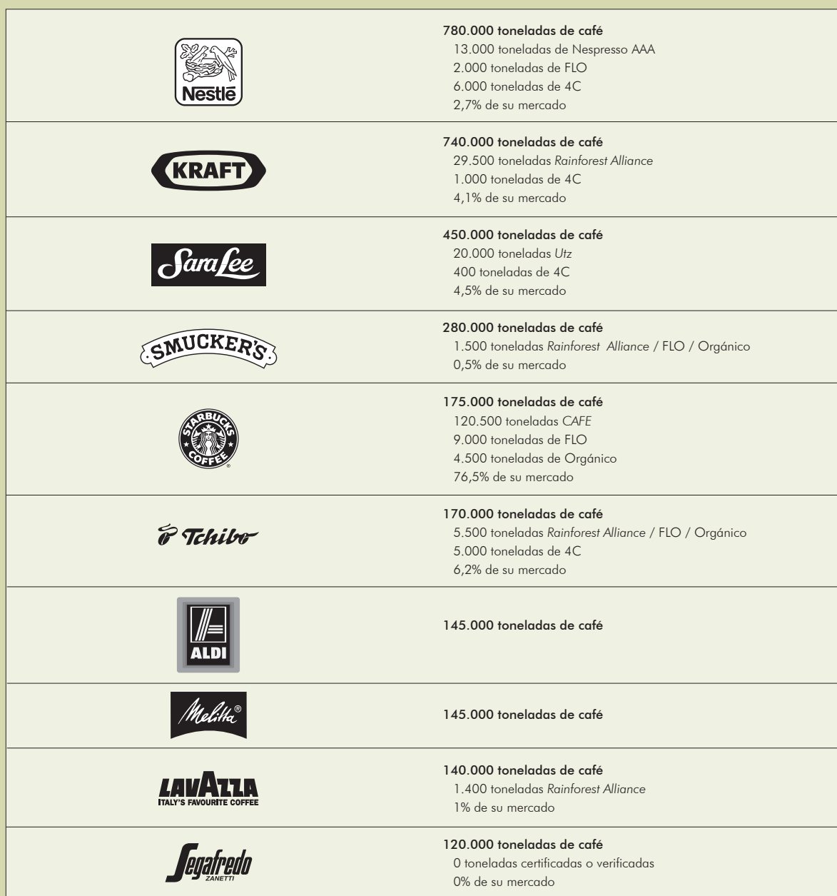
Cuadro 3. Café certificado comprado por los diez principales tostadores en 2008

Notas: 1) El cálculo de las estimaciones de las cantidades de café certificado comercializado por cada tostador es difícil de realizar porque algunas compañías no publican estos datos, por lo tanto algunas cifras son estimadas.