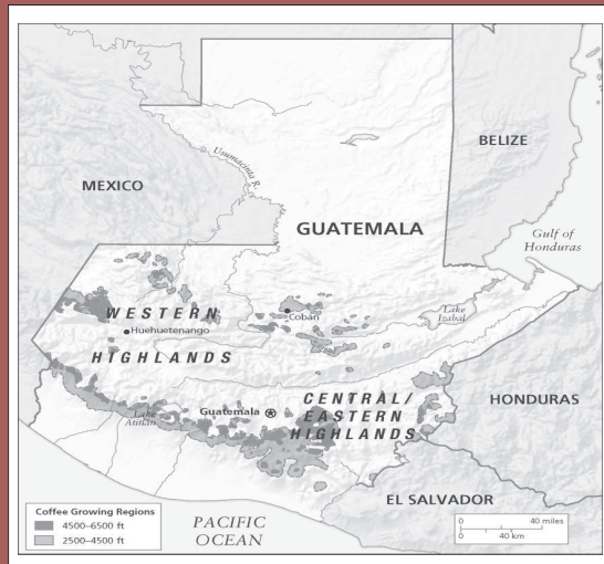
Figura 1. Regiones cafeteras de Guatemala